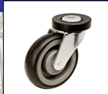
Standaard wiel 125mm

Geef uw klanten een prettige winkelervaring met soepel rollende, strak sturende winkelwagens. Zoals de winkelwagens van DCR Europe. Onze wagens staan op wielen van topkwaliteit en blijven altijd in het spoor. De standaardwielen hebben een rubberen loopvlak en zijn voorzien van precisiekogellagers, waardoor ze een lage rolweerstand hebben. Ze zijn verkrijgbaar als vast wiel en als zwenkwiel met afgedicht bovenlager. De wielen zijn beschermd tegen slijtage, stof en beschadigingen door zachte kunststof beschermringen op het wiel en op het bovenlager. Op bepaalde modellen winkelwagens is aanvullende bescherming beschikbaar in de vorm van gekleurde wielkappen. Verkrijgbaar in afmetingen van 100 of 125 mm.