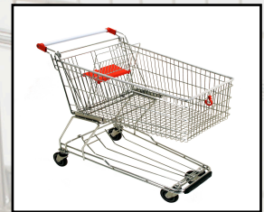
SB 150 L