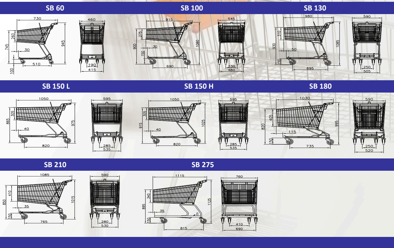
Lengte wagens in mm