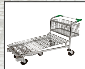
FBTM 5 wielen