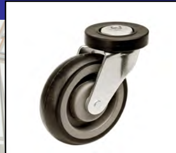
Standaard wiel 125mm

Geef uw klanten een prettige winkelervaring met soepel rollende, strak sturende winkelwagens. Zoals de winkelwagens van DCR Europe. Onze wagens staan op wielen van topkwaliteit en blijven altijd in het spoor. De standaardwielen hebben een rubberen loopvlak en zijn voorzien van precisiekogellagers, waardoor ze een lage rolweerstand hebben. Ze zijn verkrijgbaar als vast wiel en als zwenkwiel met afgedicht bovenlager. De wielen zijn beschermd tegen slijtage, stof en beschadigingen door zachte kunststof beschermringen op het wiel en op het bovenlager. Op bepaalde modellen winkelwagens is aanvullende bescherming beschikbaar in de vorm van gekleurde wielkappen. Verkrijgbaar in afmetingen van 100 of 125 mm.