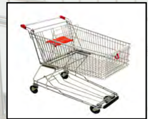
SB 150 L